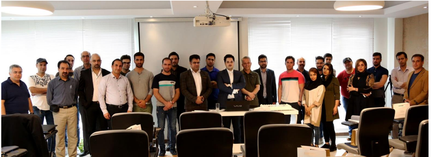
عکس یادگاری دوره هشتم خبگان بورس

به واسطه علم تحلیل من بود علم تحلیلی که سال‌های برای به دست آوردن آن تلاش و مطالعه کردم و حالا در دوره خبگان بورس به پذیرفته‌شدگان این دوره آموزش می‌دهم.